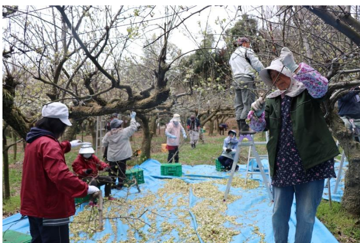
↑ 昨年の花粉採取の様子

JAしおのや梨部会で、交配用花粉を採るための花摘みが4月上旬にスタートします。花摘みを皮切りに、2021年産の梨栽培が始まります。1年1回、この時期にしか見られない作業の様子を、是非、取材をお願いします